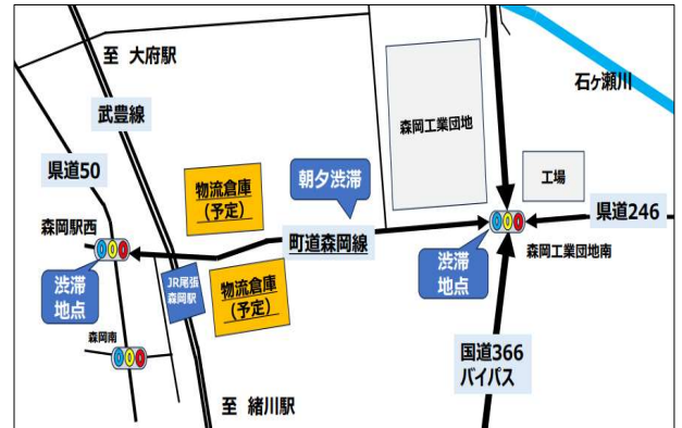
▲JR尾張森岡駅周辺の道路状況と駅東側に物流倉庫建設予定